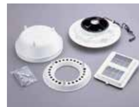
日中駆動用循環ファン