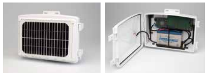
6622JP Vantage Connect(ヴァンテージ・コネクト)

ワイヤレス式Vantage Pro2用 135,000円+税 ※この他初期設定費用、年間サービスプランの契約が必要です。