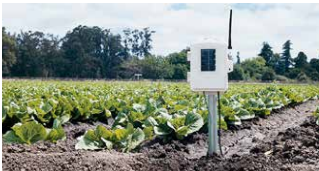
6345JP ワイヤレス式 専用オプション 技適マーク取得 リーフウェットネス/ソイルモイスチャ/温度ステーション 標準価格 47,800円+税

リーフウェットネスセンサーで木の葉の湿り気を計測、ソイルモイスチャ・センサーで土中湿度を計測できます。ステンレス温度プローブを使って、土中温度や水中の温度が計測できる送信ステーションです。 ※各種計測には、それぞれのセンサーが必要です。 ※ケーブル式ヴァンテージ・プロ2のシステムでは使用できません。