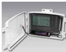
ソーラーパワーキット